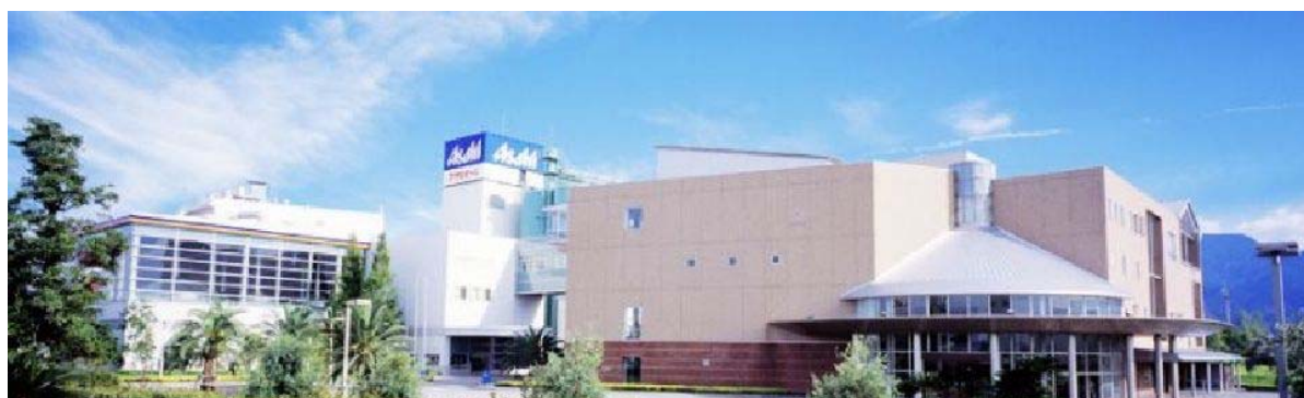
アサヒビール株式会社四国工場