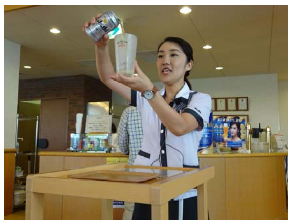
美味しいビールの注ぎ方講習状況