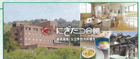
にぎたつ会館ホームページより