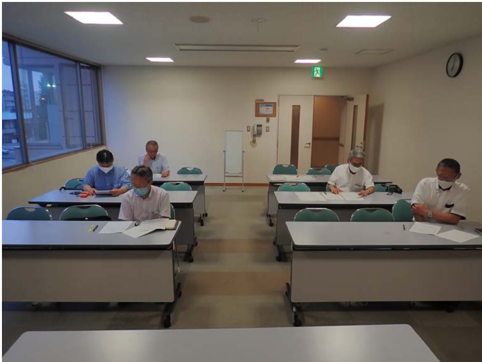
意見交換の状況

出席者による意見交換では、CPDセミナーのWeb開催の検討等の話題が上がり、総会 は約1時間程度で閉会いたしました。