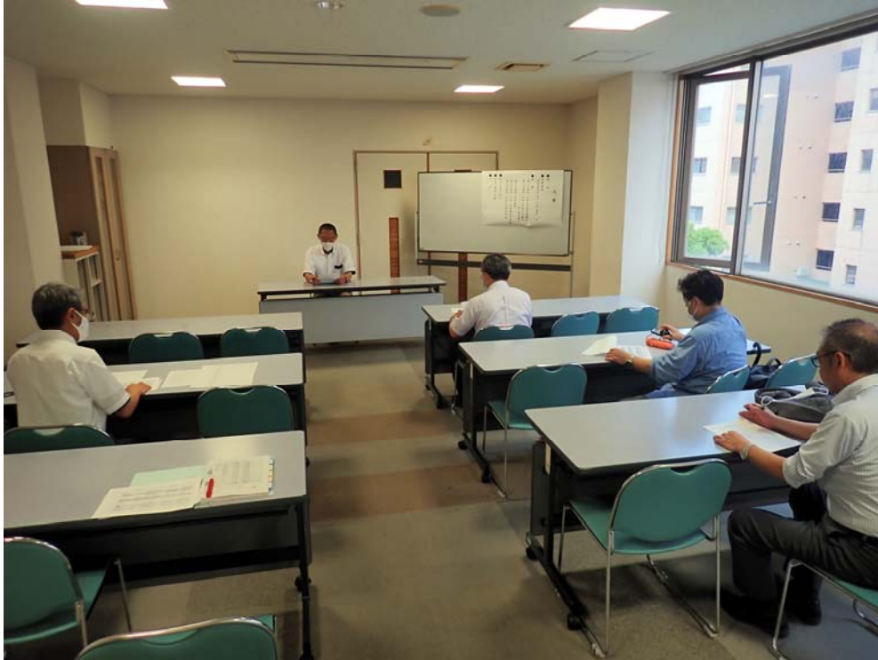
審議の状況